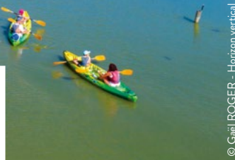
© Gaël ROGER - Horizon vertical